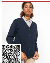
EXPLORER WOMAN CG8406