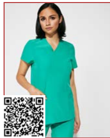
FEROX WOMAN CA9084