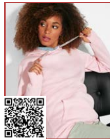
URBAN WOMAN SU1068